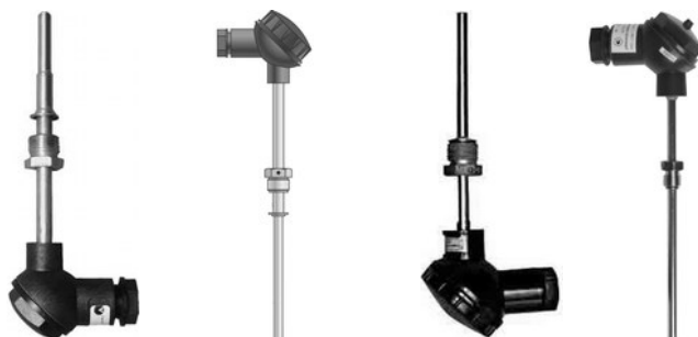
КТПТР-05 (ТПТ-15) КТПТР-01 (ТПТ-1) КТСП-Н (ТСП-Н) ТЭМ-110 (ТЭМ-100)