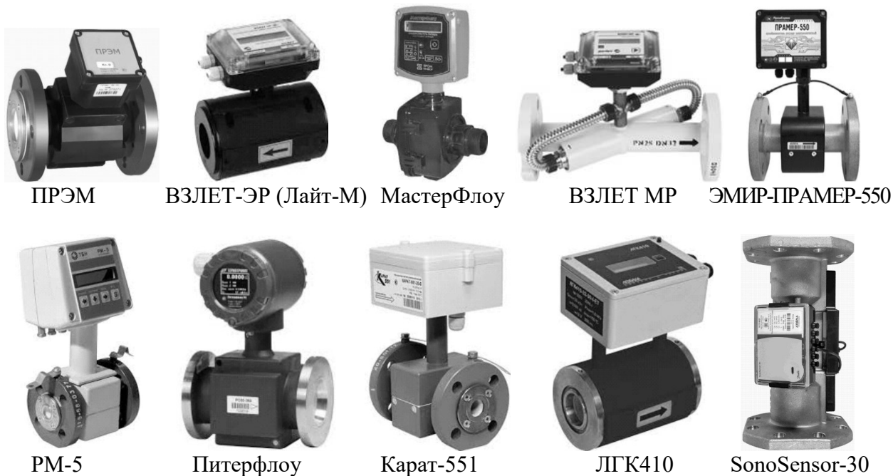
Рисунок 3 – Преобразователи расхода